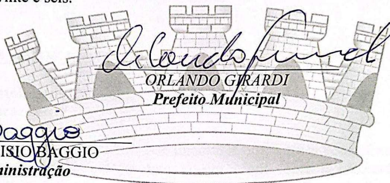
ORLANDO GIRARDI Prefeito Municipal

Gabinete do Prefeito Municipal de Frederico Westphalen/RS, aos sete dias do mês de abril do ano de dois mil e vinte e seis.